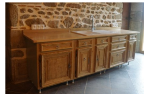
Heel trots op het resultaat!