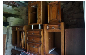
Restant keuken in de opslag