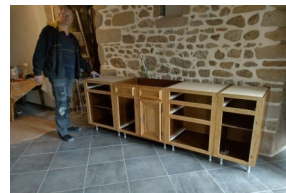
We zijn er bijna!