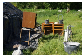
Mooi weer voor zandstralen