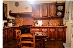
Keuken op 'le bon coin'

...die knapt zelf spulletjes op. Onze zandstraler is zo'n geweldig stuk gereedschap. Daarmee toverden we de lichte eiken kleur van de keukenkastjes weer tevoorschijn. Beetje lakken, plaatsen, werkblad erop, nog wat afwerking en voilà!