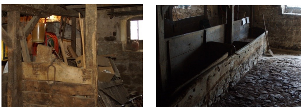
Deel van de schuur vóór en na opruimen!

Voordat we daadwerkelijk aan de slag kunnen met verbouwen, moet er nog heel wat leeggeruimd worden. Langzaam krijgen we zo meer overzicht op hoe we het verder gaan aanpakken. Zo zijn we ook in gesprek met de Franse Kamer van Koophandel over diverse subsidies. Iedereen is heel vriendelijk en behulpzaam hier. Dat doet goed.